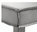
Ref: CTV Costura en "V" / "V" Sewing