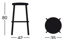
Ref: 699 Taburete / Barstool