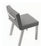
Ref: TR Asa / Handle